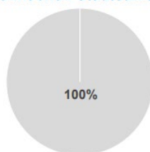
1. Taxonomie-Konformität der Investitionen einschließlich Staatsanleihen*

● Taxonomiekonform ● Andere Investitionen